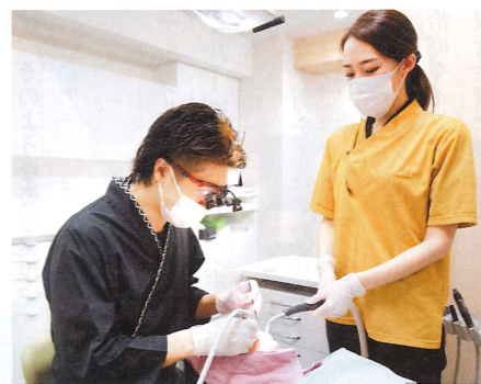
さきがけ歯科クリニック 摂津本院 院長

もともとは医師を目指して受験勉強をしていたのですが、そんな中、父が病気で急死して。医療で救えない命があることに愕然とし、「自分の手で確実に患者さんを治し、笑顔にできる仕事に就きたい」と思うようになりました。歯科医師へと進路転換したのも、ほぼすべての症状を完治させられる仕事だと思ったからです。大学卒業後は附属病院の口腔外科に在籍し、口腔がんの研究に力を注いでいました。しかし他分野のドクターと話をする中で、「一つの分野に特化するよりも幅広い診療を学んだ方が、より多くの患者さんの要望に応えられるのでは」と感じ始めたんです。それから一般開業医に勤め、矯正や咬み合わせ、審美補綴など多様な分野を習得しました。そして当院を開業し